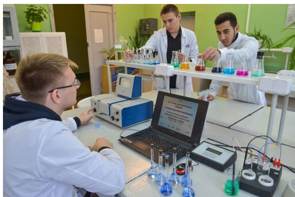
На занятиях по химии

Для обеспечения образовательного процесса на факультете имеются зоологический музей с большим количеством редких уникальных экспонатов, специализированные лаборатории, научный гербарий Белорусского Полесья, учебно-научная база «Ченки» и др.