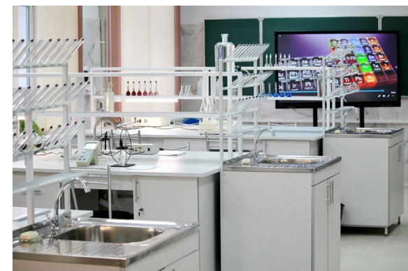
Лаборатория аналитической химии