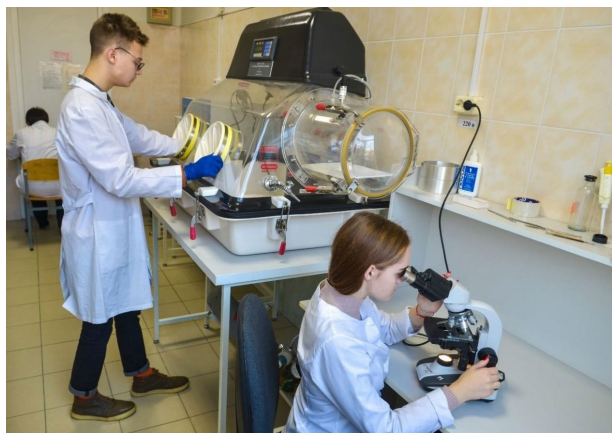
В лаборатории микробиологии

На факультете созданы все условия для занятия научной работой: имеются лаборатории, современное оборудование, высококвалифицированный профессорско-преподавательский состав.