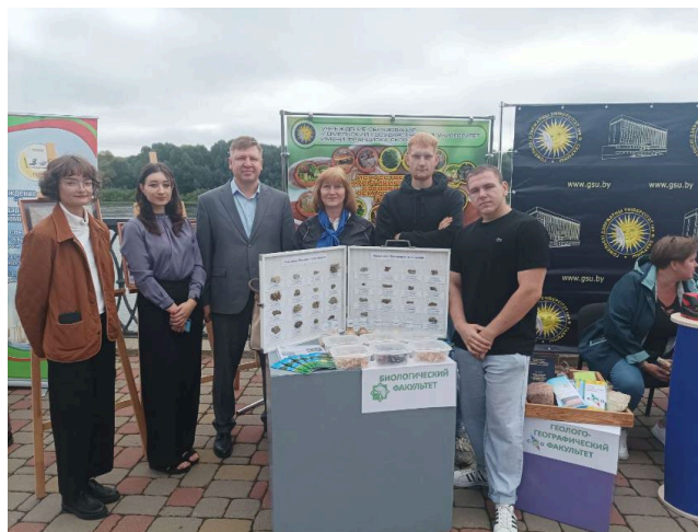
На интерактивной выставке

Наряду с учебной и научной работой студенты университета принимают активное участие в общественных и спортивных мероприятиях.