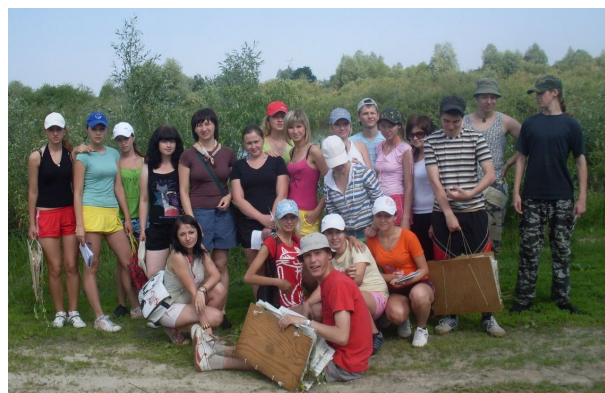
Полевая практика по ботанике