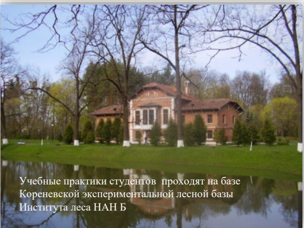
Учебные практики студентов проходят на базе Корневской экспериментальной лесной базы Института леса НАН Б

Наведите камеру своего смартфона на QR-код: