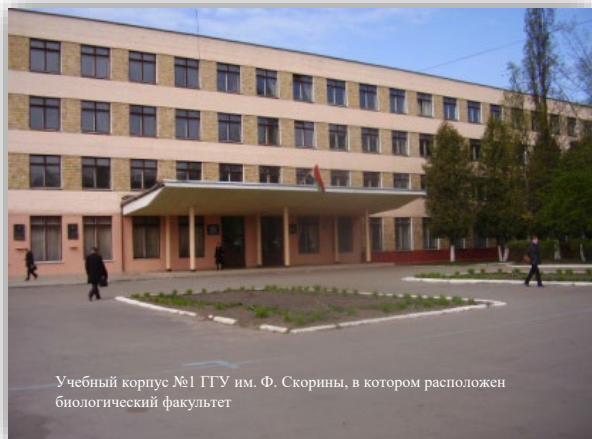
Учебный корпус №1 ГГУ им. Ф. Скорины, в котором расположен биологический факультет