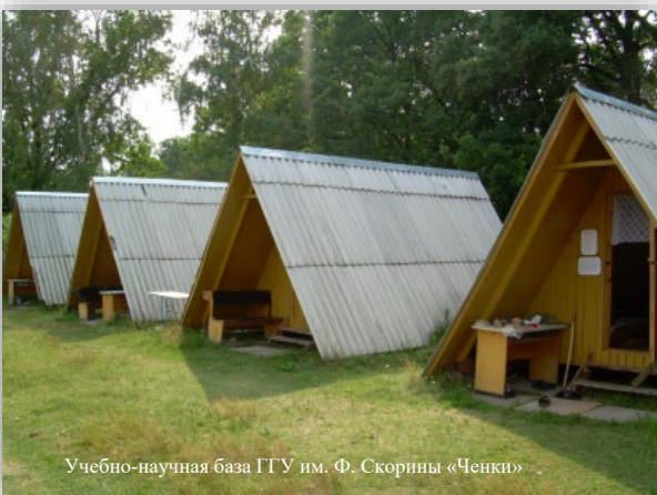
Учебно-научная база ГГУ им. Ф. Скорины «Ченки»